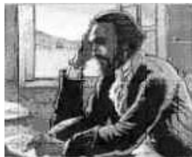
João Ferreira de Almeida

Todos os anos aqui no Brasil, no segundo domingo de dezembro comemora-se o Dia da Bíblia. Historicamente essa comemoração teve início em 1549, na Grã-Bretanha, quando o bispo Crammer, incluiu no livro de orações do Rei Eduardo VI um dia especial para que a população intercedesse em favor da leitura do Livro Sagrado. A