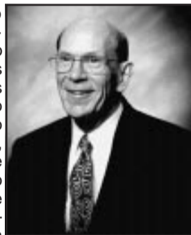
Dr. Jerry Bridges

O Seminário Batista Regular de São Paulo e a Ordem dos Pastores Batistas Regulares de São Paulo, com apoio da ABEM, OANSE, ABC, Jornal de Apoio e Associação Batista Regular de São Paulo, promovem nos dias 19 a 22 de junho a Conferência Anual para Líderes e Pastores sob o tema: "O Pastor e sua intimidade com Deus".