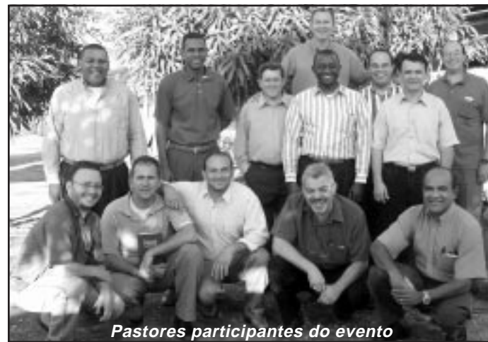
Pastores participantes do evento

Dias 26 e 27 de dezembro aconteceu o primeiro Retiro de Pastores da Região Nordeste do Estado de S. Paulo no Recanto Areté, Franca-SP. O grupo foi pequeno, neste primeiro encontro que serviu de base para o planejamento do próximo que deverá acontecer nos dias 3 a 7 de julho de 2006. Este retiro, que é exclusivo para pastores e obreiros que estejam na liderança de igrejas ou congregações recebeu o nome permanente de "Um Lugar à Parte", baseado no texto de Marcos 6:31.