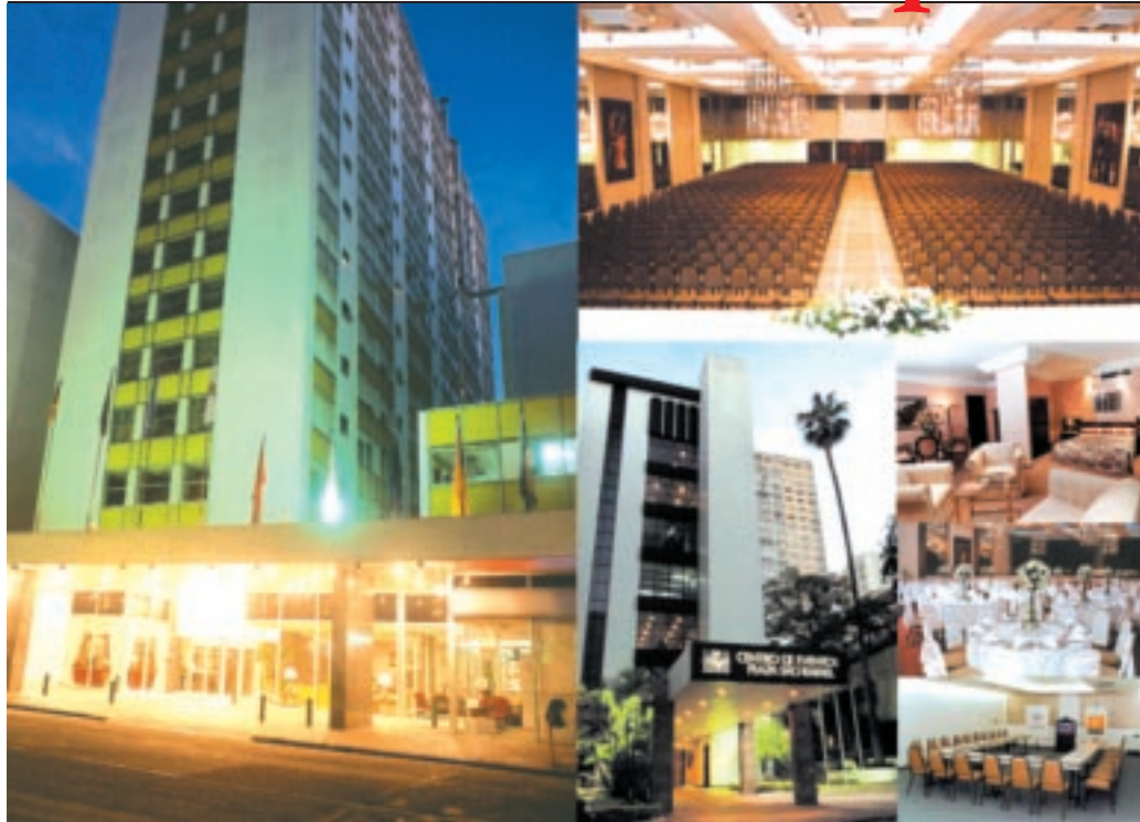
Hotel Plaza São Rafael

No período de 13 a 16 de fevereiro de 2006, os Batistas Fundamentalistas de todo o Brasil, incluindo Batistas Independentes, Regulares e Bíblicos, além de outras igrejas igualmente de posição fundamentalista, estão convidadas a participar do VI Congresso Batista de Fundamentalismo Bíblico na cidade de Porto Alegre-RS.