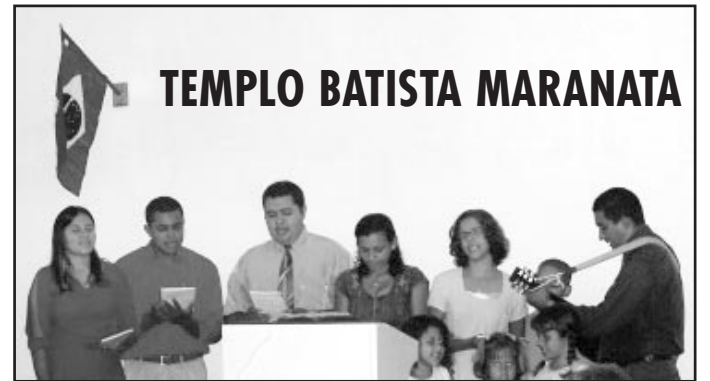
Grupo musical em apresentação no culto