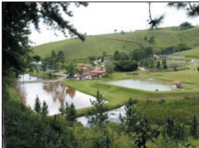
Vista do hotel Vale dos Cedros

"Crescimento da Igreja" é o tema geral do Retiro de Pastores que acontecerá no Hotel Fazenda Vale dos Cedros nos próximos dias 23 a 27 de janeiro de 2006.