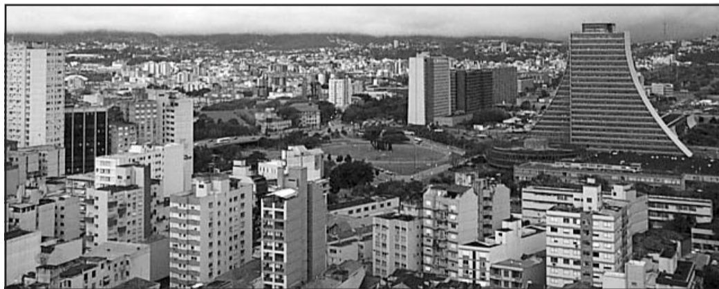
Vista parcial de Porto Alegre-RS