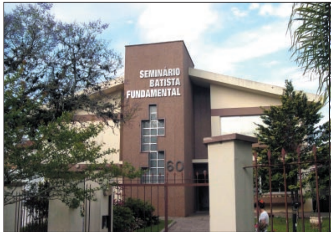
Fachada do Seminário Batista Fundamental em Porto Alegre-RS