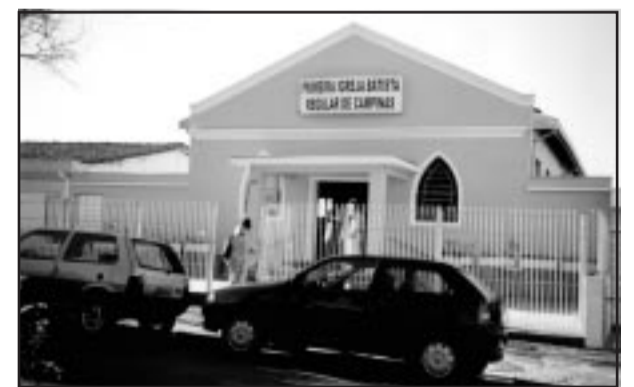
Primeira Igreja Batista Regular

Dos ministérios locais da igreja fazem parte um programa de rádio, O A N S E, Jornal de Bairro, Equipe de Apoio Evangelístico, Curso de Artesanato com fins