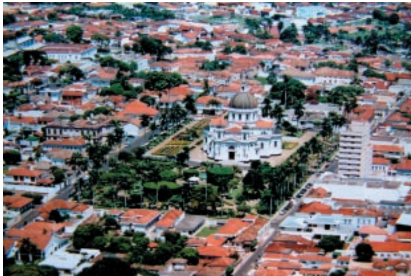
Vista aérea de Batatais

2010, a média de pessoas que frequentam as igrejas é de 70 membros ativos. O