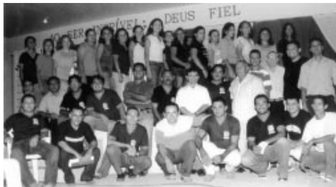
A foto mostra parte do corpo docente e discente do SETEM

Para maiores informações: www.igrejadafe.org.br