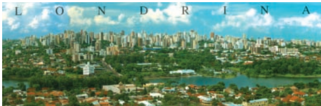
Vista panorâmica de Londrina e o lago Igapó

O estado do Paraná tem sido abençoado pelo ministério radiodifusão da BBN Internacional (RRB Rede de Radiodifusão Bíblica). A capital, Curitiba, e cidades adjacentes é alcançada pela 92,3 FM e Londrina e região Norte do Estado, tem a 96,1 FM. No estado de São Paulo, a BBN alcança o Vale do Paraíba através da 93,5 FM.