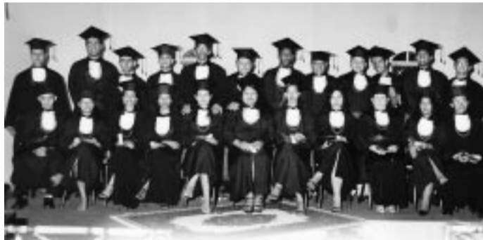
Formandos de Campo Grande-MS, no Instituto Batista Bíblico Regional