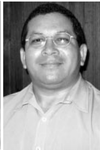
Pr. Pedro Evaristo