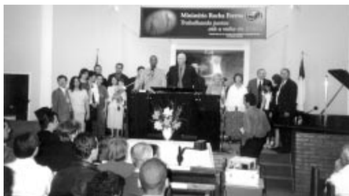
Missionários e voluntários da Rocha Eterna apresentados durante as conferências