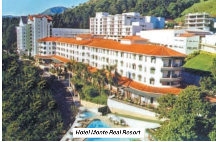
Hotel Monte Real Resort

Realizada desde 1984, acontece nos dias 4 a 8 de outubro de 2004 a vigésima edição da Conferência Fiel Para Pastores e Líderes. Este ano o tema é “Vida e Doutrina”, baseado na expressão de I Timóteo 4:15, “Tem cuidado de ti mesmo e da doutrina...”