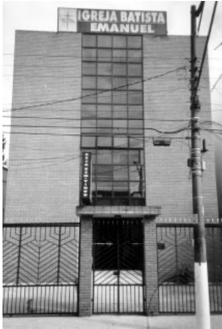
Fachada da Igreja