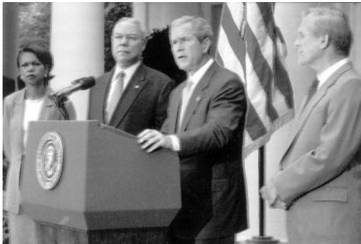
Estados Unidos - Força política. Na foto, Bush e principais assessores

aprovou uma lei proibindo a expressão religiosa nas escolas públicas francesas (II Ts. 2:4-7). A nova lei proíbe, inclusive, o uso de símbolos religiosos nas escolas públicas francesas: cruzeiros (catolicismo romano) véus (muçulmanos), solidéus (judeus) ou camisas com textos bíblicos (protestantes). A medida proíbe, inclusive, que os alunos levem a Bíblia, Torá, Alcorão, ou qualquer outro livro religioso de uso pessoal para a escola. O evangelismo e proselitismo já são proibidos na França, pois ameaçam a liberdade das pessoas e perturbam a ordem pública. Essa proibição já é