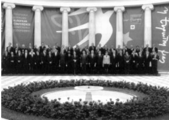
União Européia - Força econômica. Na foto, governantes europeus

O espírito do Anticristo já está em plena operação. No início de 2004 o Parlamento da França