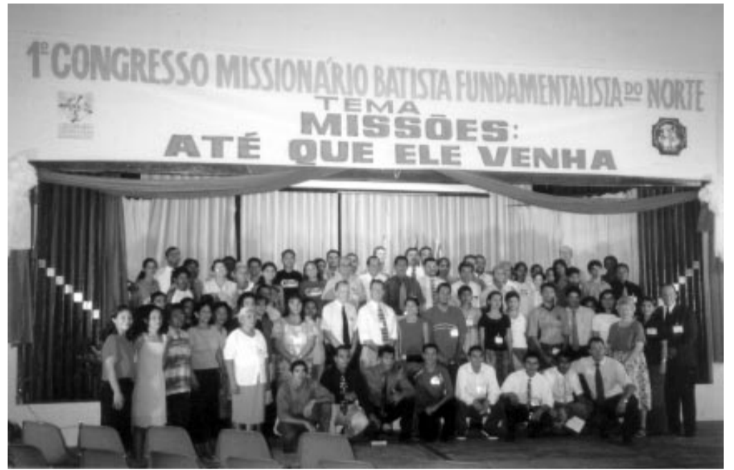
Parte dos participantes do congresso no Pará

Valeu a pena! Esta é a expressão que queremos estampar ao avaliarmos o Primeiro Congresso Missionário Batista Fundamentalista do Norte realizado nos dias 13 a 16 de novembro último em Ananindeua - PA. O evento foi organizado pela Comunhão Missionária Batista Independente - CMBI, e pela Associação Missionária Independente - AMI, contando com o apoio da Sociedade Bíblica